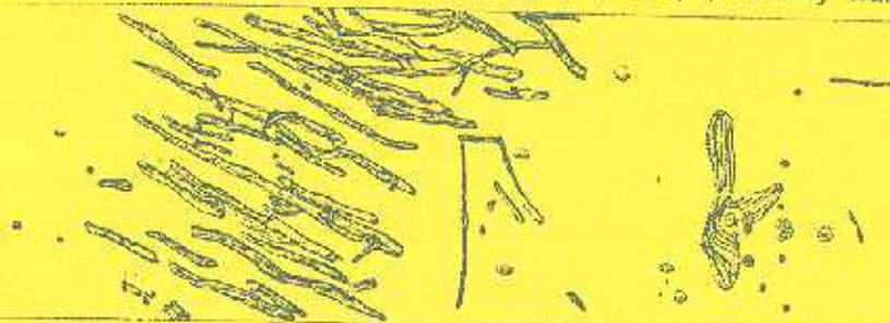
Drewniana konstrukcja podstawy wału

Tak ciężka konstrukcja wału groziła rozsunięciem się na podmokłym gruncie doliny Wieprzy. Budowniczo wie grodu zdawali sobie z tego sprawę i zastosowali rozwiązanie techniczne, które zabezpieczyło wał przed naturalnym zniszczeniem. Zanim zaczęto sypać piasek tworzący wał zbudowano skomplikowaną konstrukcję drewnianą stanowiącą podstawę wału i stabilizującą go. Konstrukcja ta składała się z kilku rzędów pali wbitych ukośnie w grunt (konstrukcja palisadowa) oraz podłużnie i poprzecznie układanych belek drewnianych (tzw. konstrukcja przekładowa). Elementy konstrukcji przekładowej łączone były z wbitymi palami na wiele wymyślnych sposobów (rygle), bez użycia żelaznych ćwieków. W budowie drewnianej konstrukcji podstawy wału