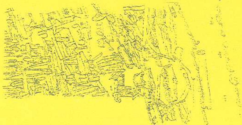
Drewniana konstrukcja drogi

Mieszkańcy grodu zajmowali się hodowlą zwierząt, uprawą roli, tkactwem, produkcją naczyń ceramicznych, ciesiolką, itp. Znajduje to potwierdzenie w odkrywanych materiałach: kościach zwierzęcych, szczątkach roślin uprawnych (oprócz ziaren zbóż, również snopek lnu), przyrządów do obróbki włókien roślinnych i